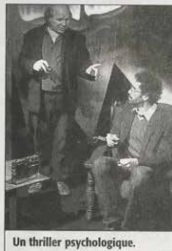
Un thriller psychologique.