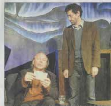
Les variations énigmatiques : une pièce pleine de rebondissements à découvrir au Célimène.

À 15h02 (9) au théâtre le Célimène, 25 bis rue des Remparts de l'Oulle, Plan N° 25, Domic 11025. Réservations : 04 90 82 96 13.