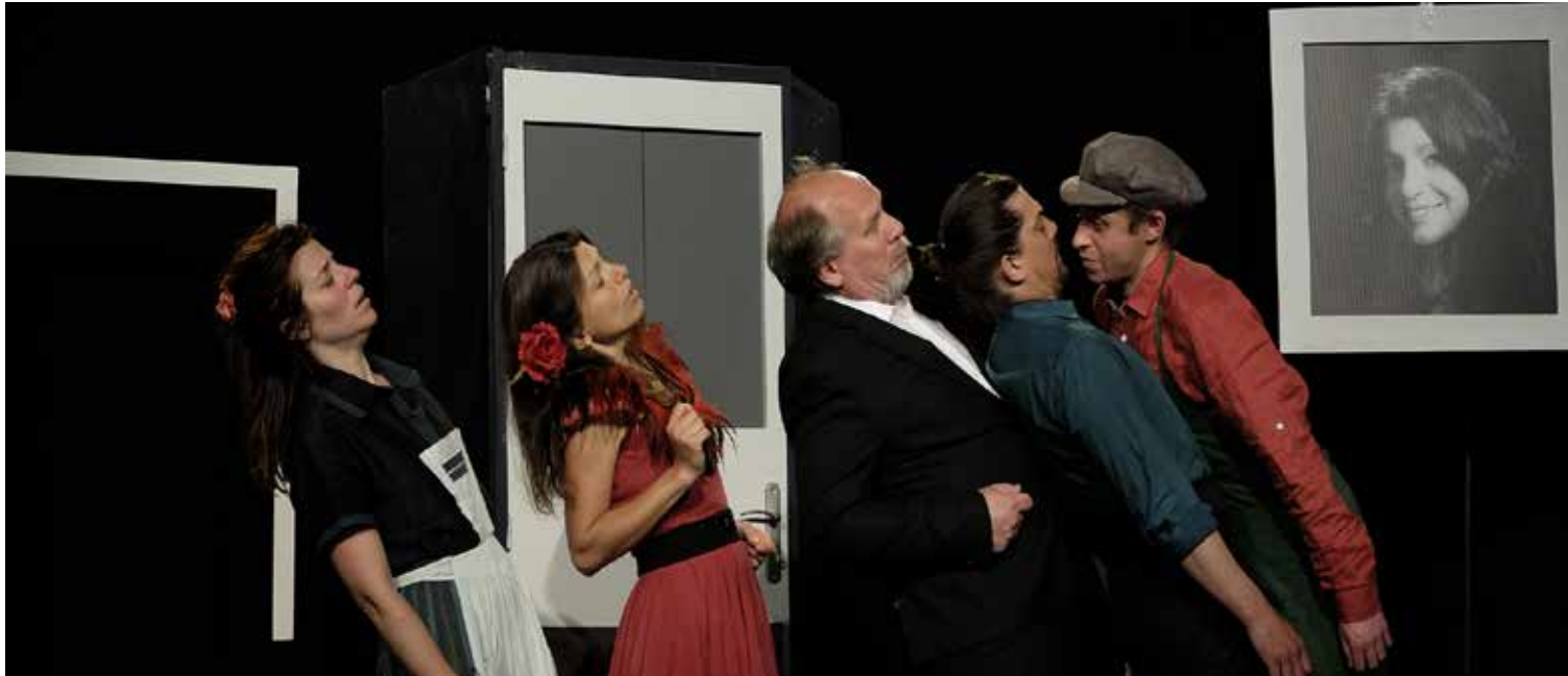
Photo répétition en construction...

Tel un vaudeville, les portes se ferment, s'ouvrent, claquent avec leurs lots de surprises. Là des fenêtres remplaceront les portes mais auront la même fonction ! Elles serviront aussi de portrait, d'effets de loupes sur les travers de nos personnages. Portrait de nantis (Comte, comtesse), de serviteurs gens du peuple (Figaro, Suzanne...). Nous utiliserons aussi tous les ressorts de la comédie, dans le jeu, la direction d'acteur, le rythme ! Les costumes seront plutôt de style intemporel...