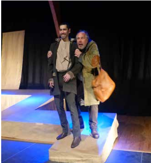
« JACQUES LE FATALISTE » DIDEROT