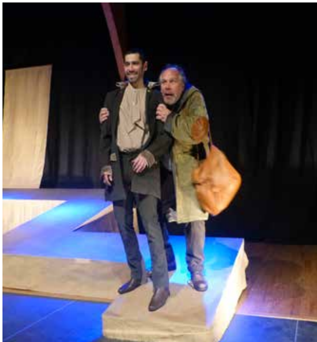
« JACQUES LE FATALISTE » DIDEROT